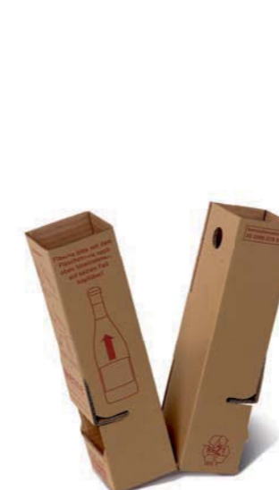
2er KOMPACT-Einlage für 1er und 2er Größe, Einlage ist teilbar

Aufgrund der max. möglichen Gewichtsgrenze bei Paketdiensten wurde dieser Karton nur für 0,75 l Schlegel-, Bordeaux- und Burgunderflaschen getestet. Bitte überprüfen Sie das Gesamtgewicht der fertig gepackten Pakete.