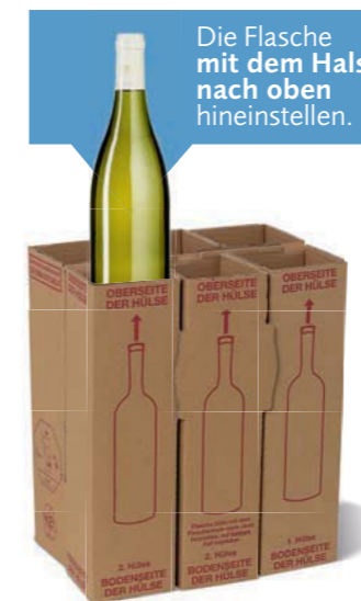
6er KOMPACT-Einlage für 3er, 6er, 12er, 15er und 18er Größe Einlage ist teilbar

! Einlagen generell zuerst in den Karton stellen und dann mit Flaschen befüllen.