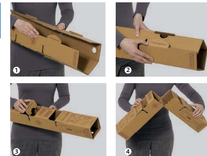
Einlage ist teilbar